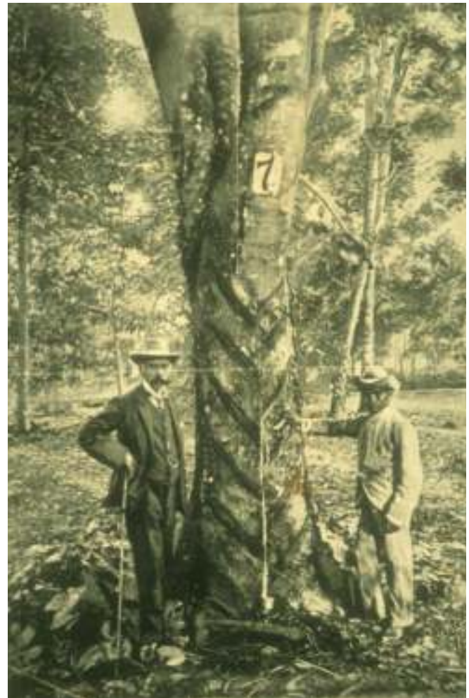
Sir Henry Nicholas Ridley with an original para rubber tree in the Economic Garden.

By 1890s, Mr Ridley was walking around with bags of rubber seeds persuading coffee planters to switch to rubber cultivation. Often, he also visited Straits Settlements plantation owners with his jacket pockets filled with rubber seeds from the 1000 mature trees growing in the gardens. By 1912, when Ridley retired, nearly 600,000 acres of land were planted with rubber.