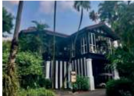
E J H Corner House